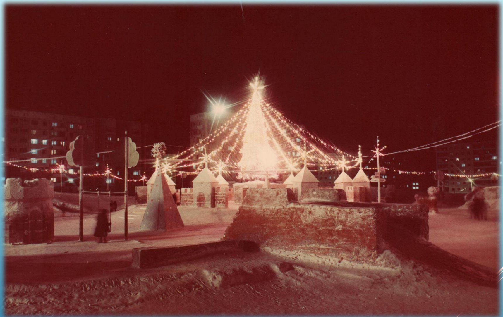
Снежный городок и новогодняя ёлка на площади Metallургов г. Норильск, 1987 г.