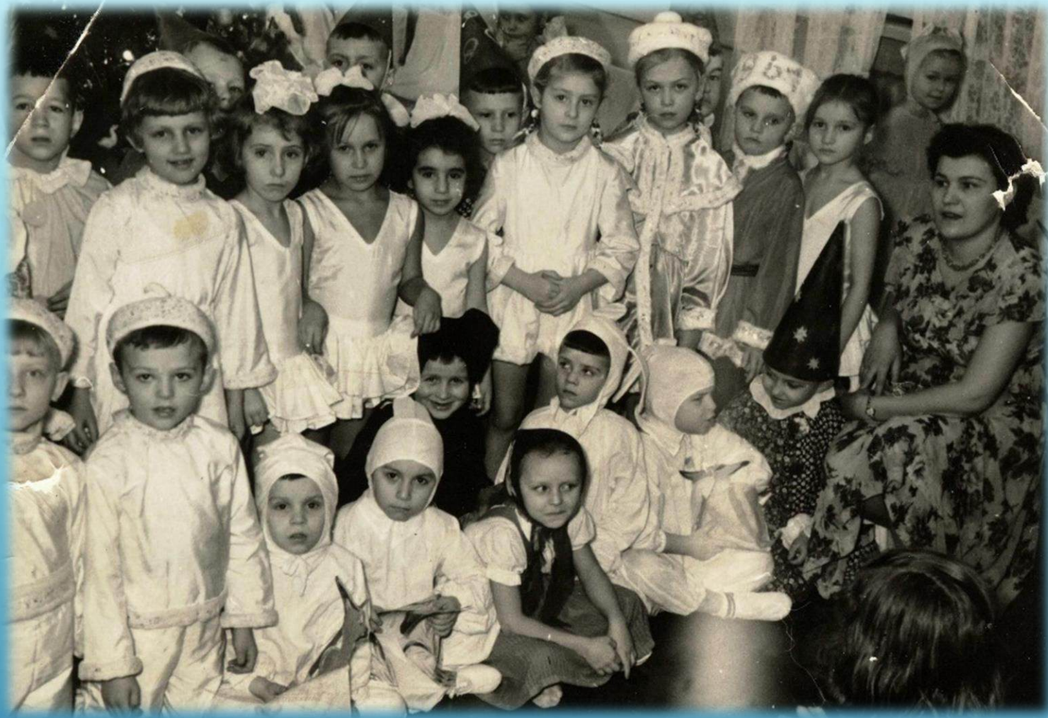
Коллективное фото воспитанников детского сада г. Норильск, 1960 г.