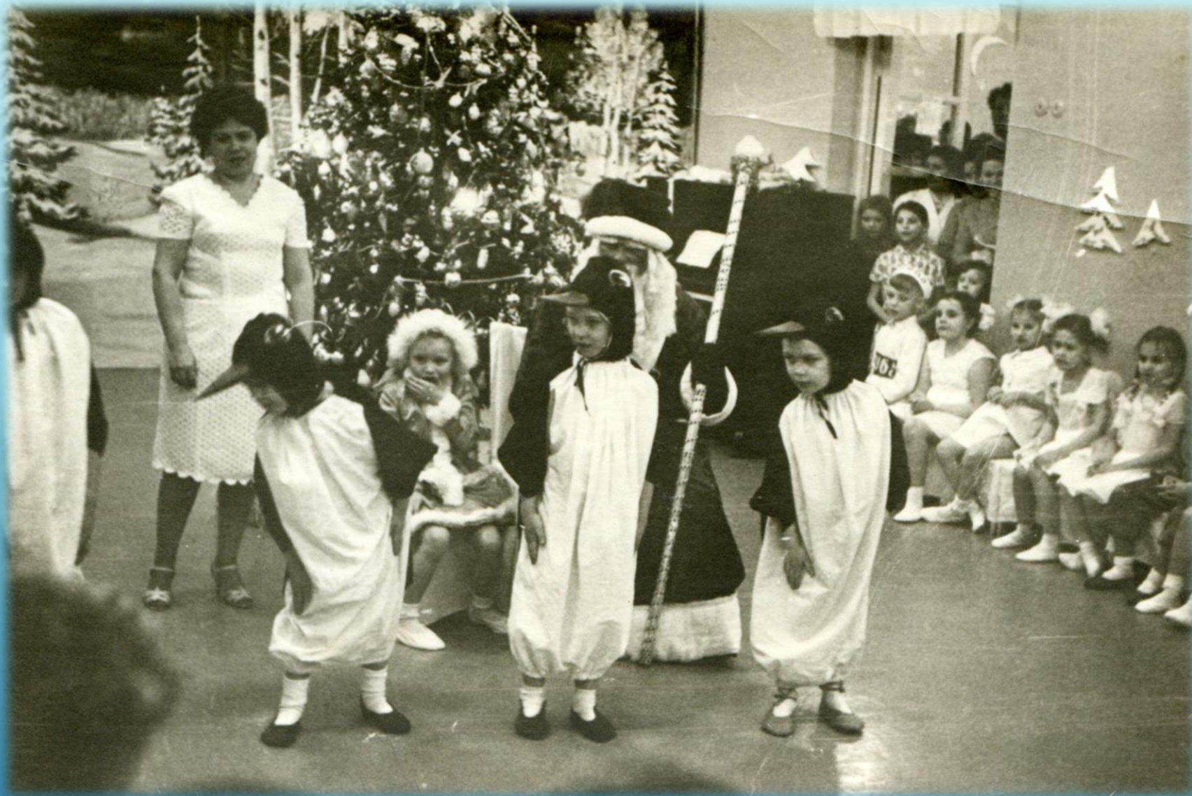
Новогодний утренник в детском саду № 8. Дед Мороз в гостях у ребят г. Норильск, 1960 г.