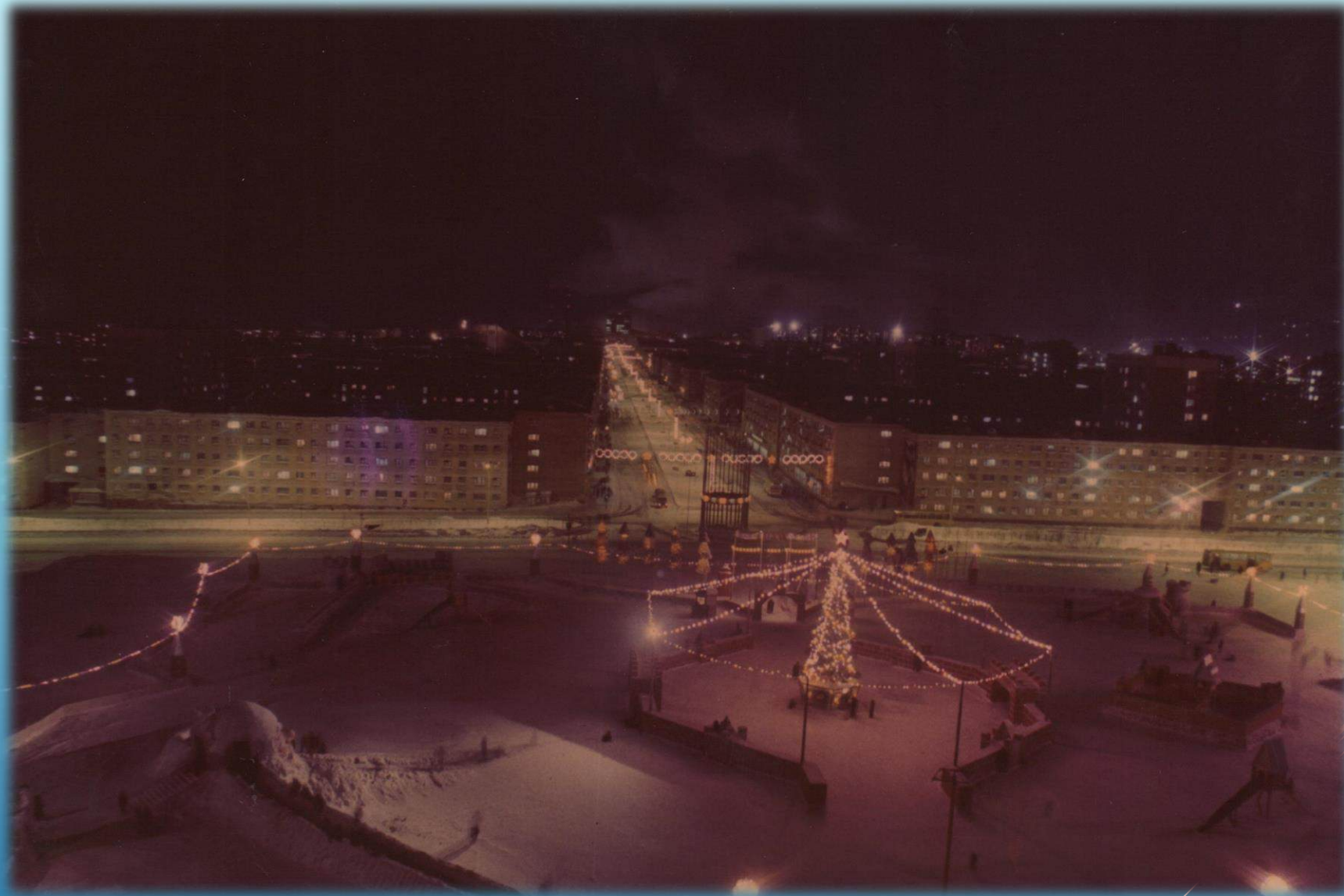
Снежный городок на площади Metallургов г. Норильск, 1988 г.