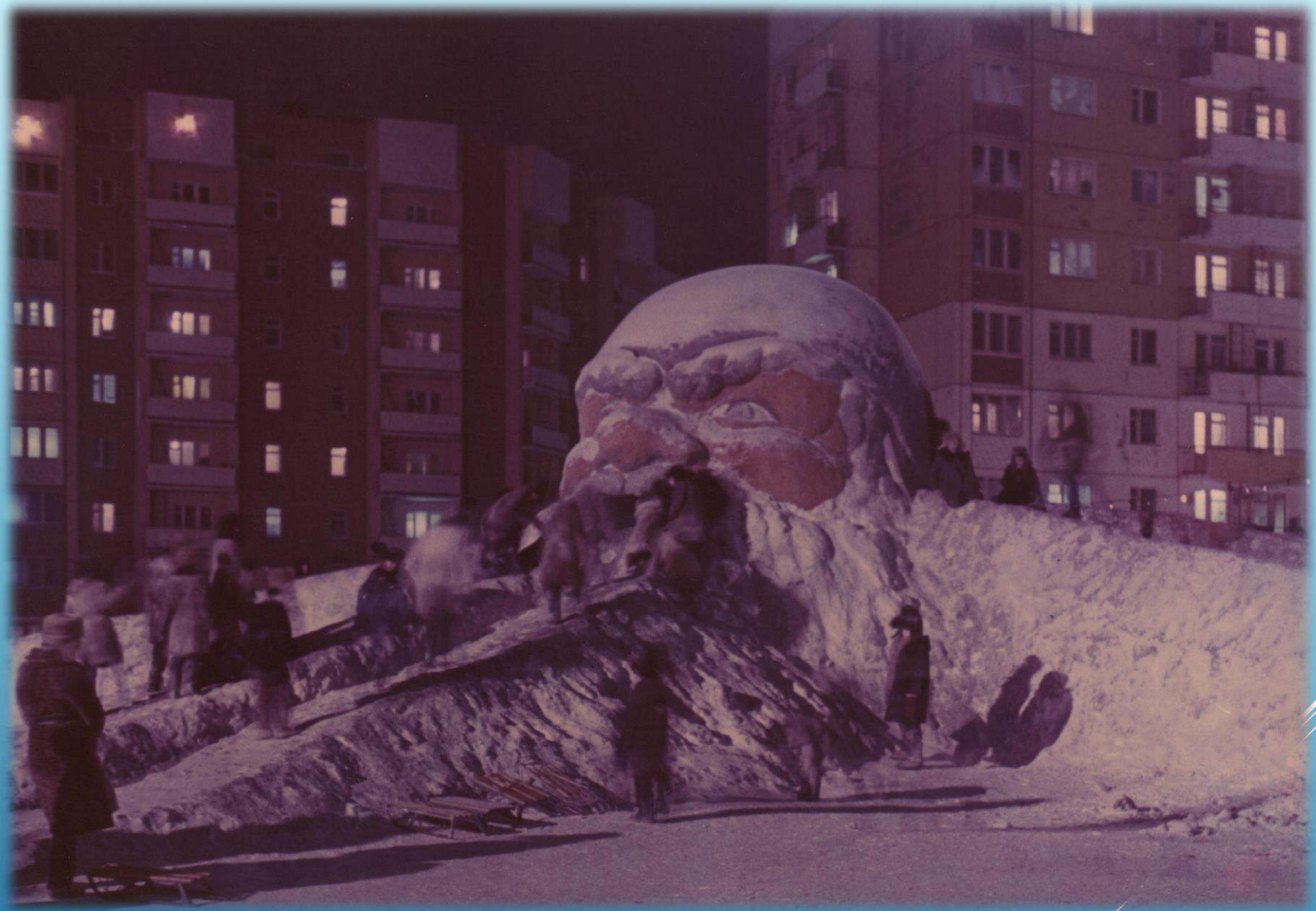
Снежная горка на площади Metallургов г. Норильск, 1988 г.