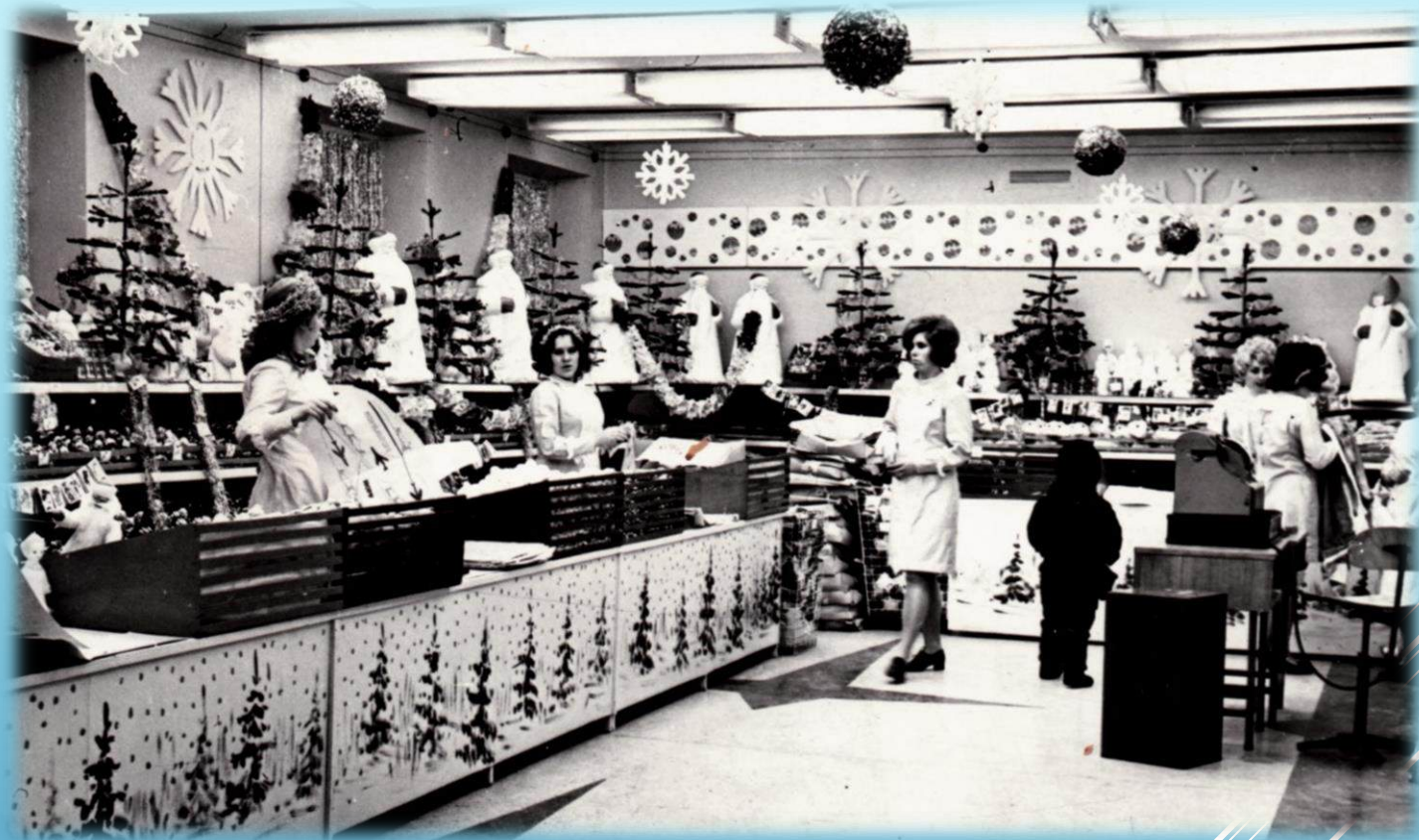
Новогодний базар в магазине «Северок» г. Норильск, 1977 г.