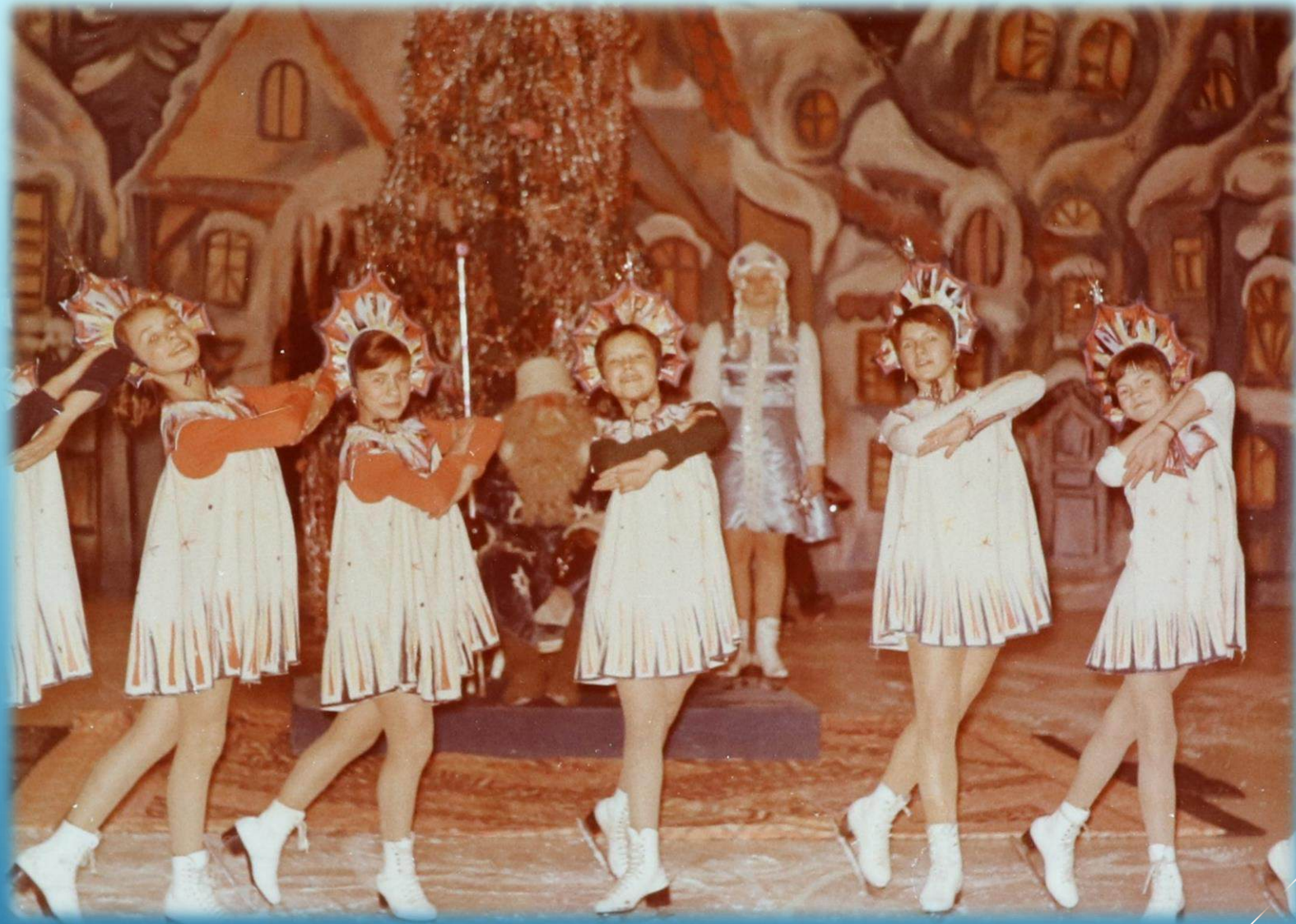
Новогоднее представление во Дворце спорта «Арктика» г. Норильск, 1984 г.