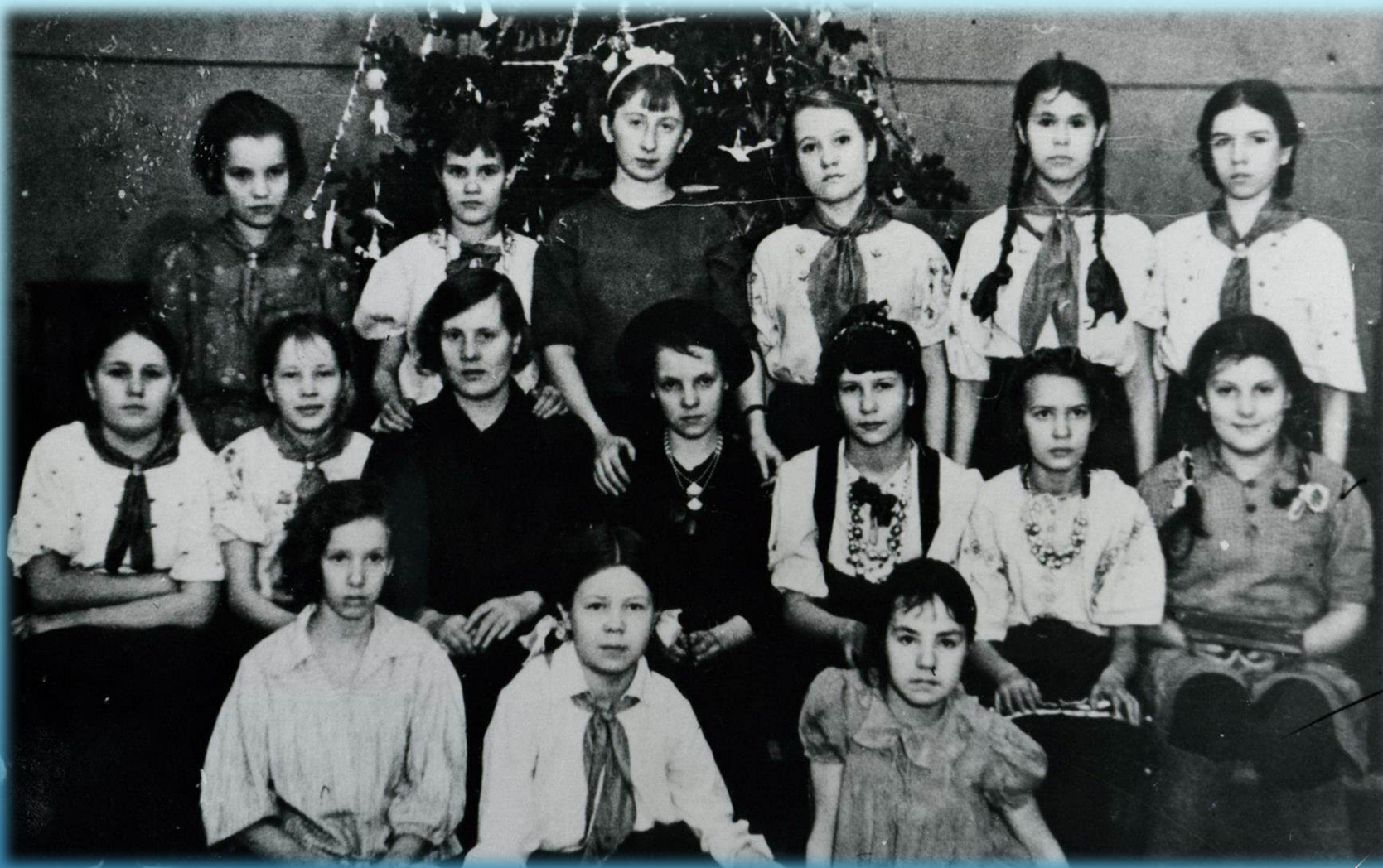
Новогодний праздник в Доме инженерно-технических работников пос. Норильск 1942 г.