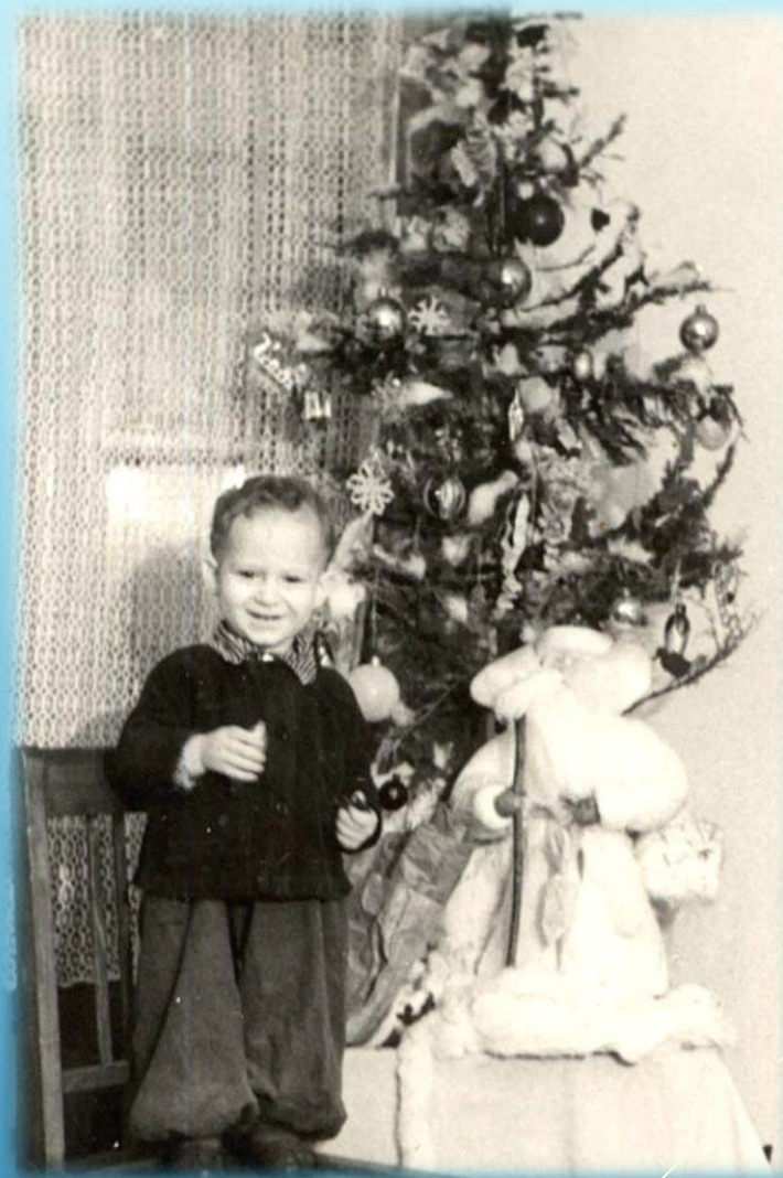
Новый год в балке г. Норильск, 1955