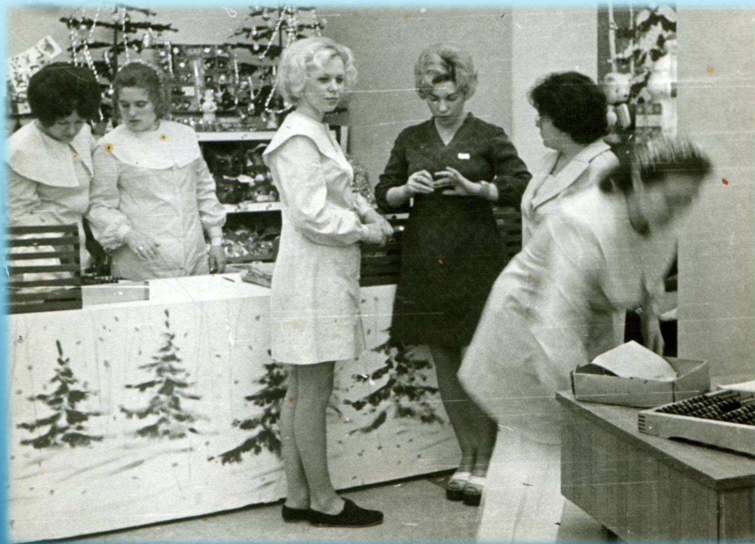
Новогодний базар в отделе игрушек магазина «Северок» г. Норильск, 1976 г.