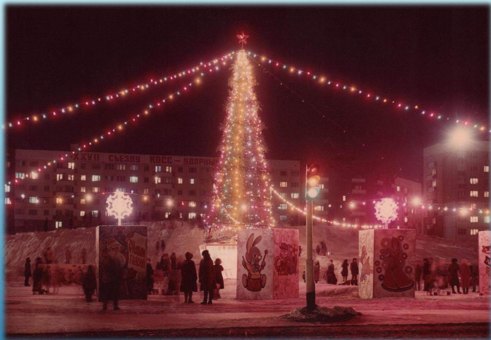
Снежный городок и новогодняя ёлка на площади Metallургов г. Норильск, 1986 г.