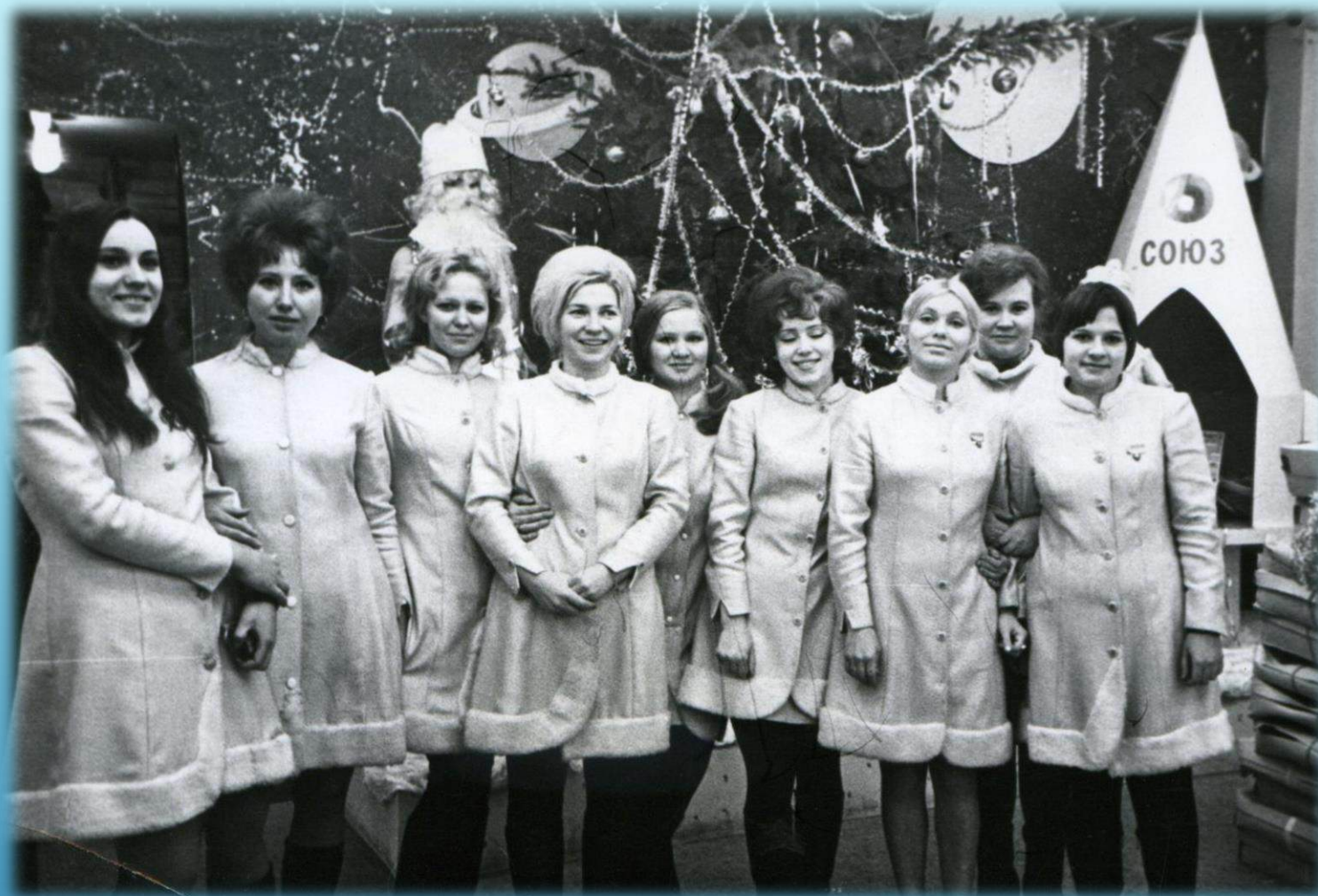
Продавцы магазина «Северок» в костюмах Снегурочек г. Норильск, 1974 г.