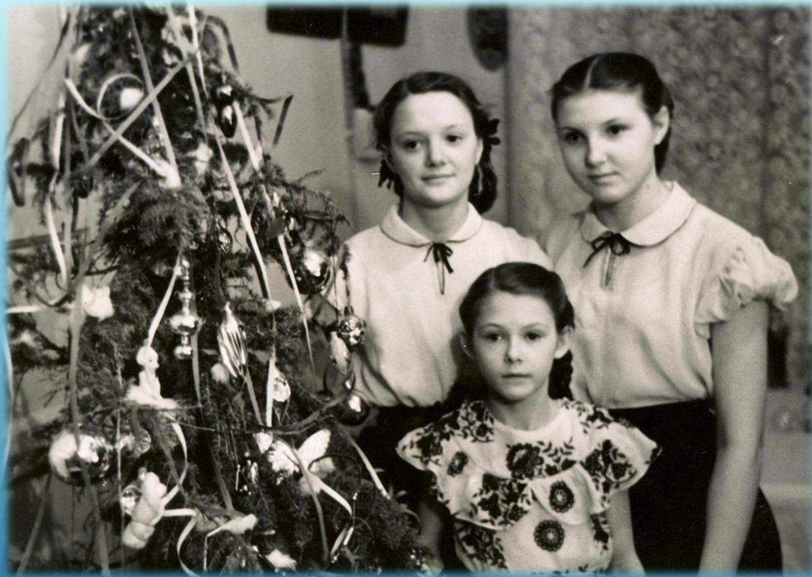
Сестры Пронские дома у новогодней елки г. Норильск, 1958 г.