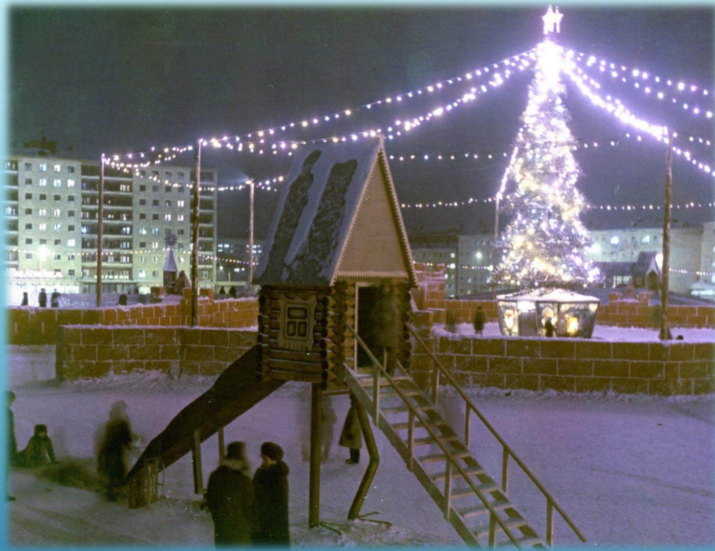
Новогодний городок на площади Metallургов г. Норильск, 1988 г.