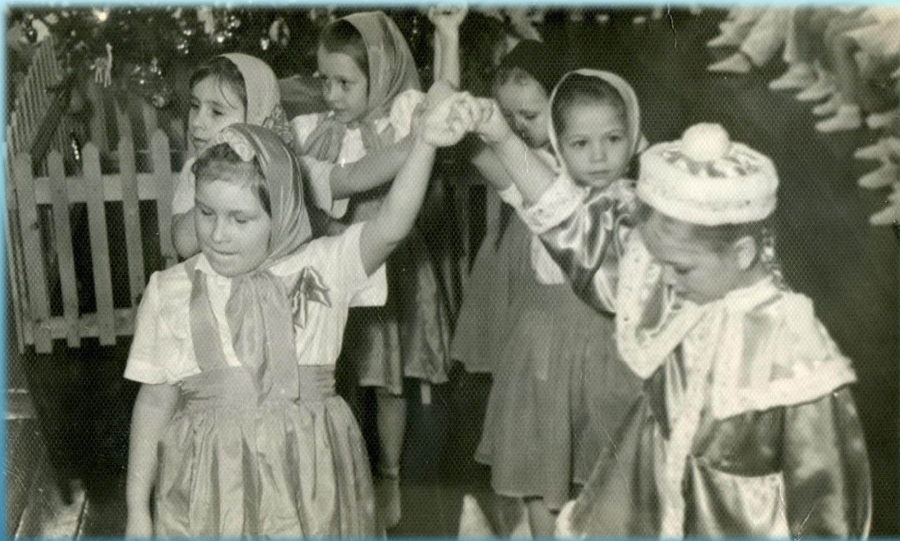
Новогодний утренник в детском саду на проспекте Сталина г. Норильск, 1958 г.