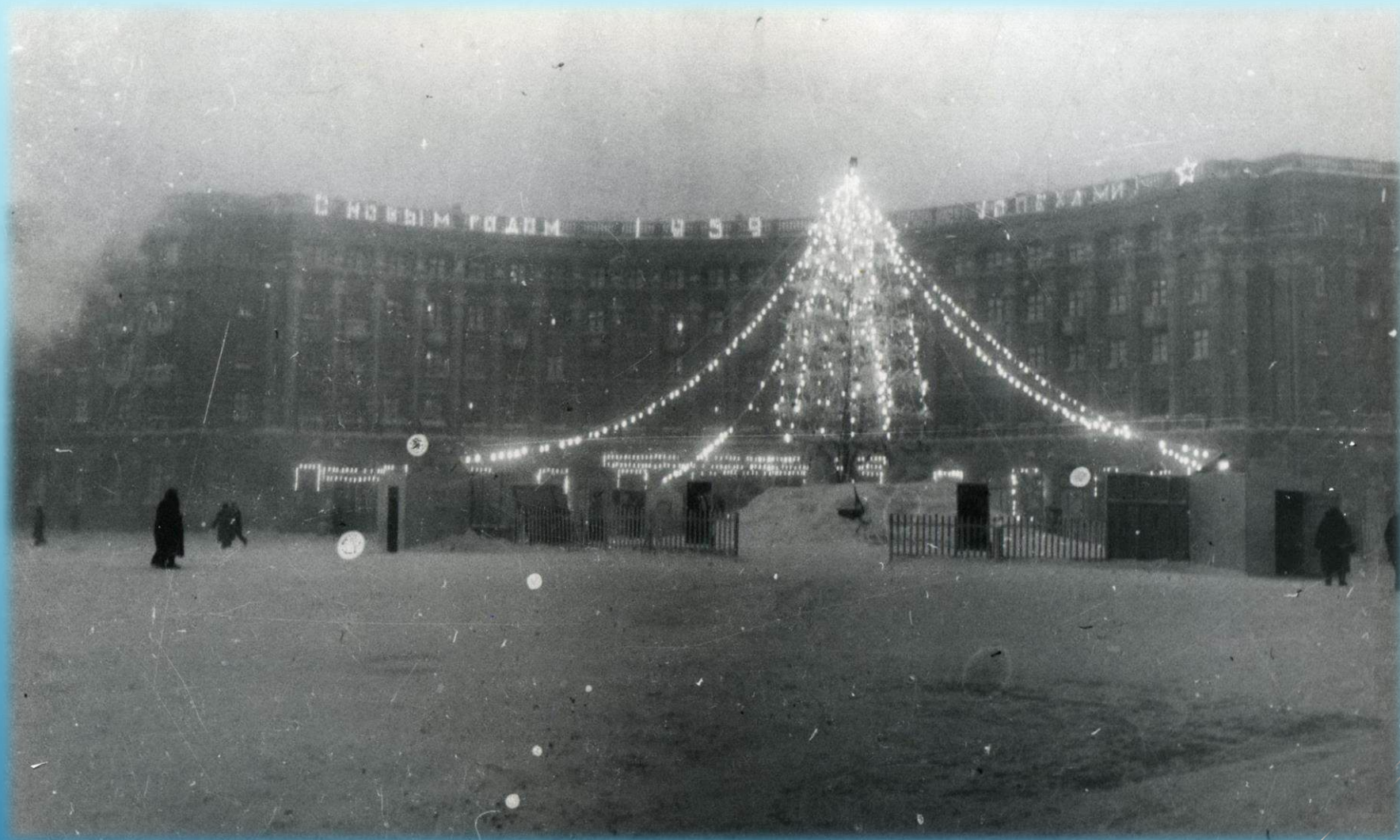
Новогодняя ёлка на Гвардейской площади г. Норильск, 1959 г.