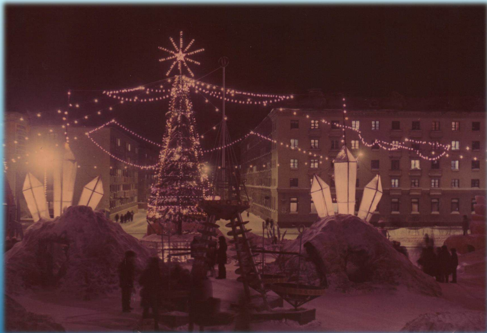
Новогодняя ёлка и снежный городок на проспекте Ленина, между домов 19 и 25 г. Норильск, 1988 г.