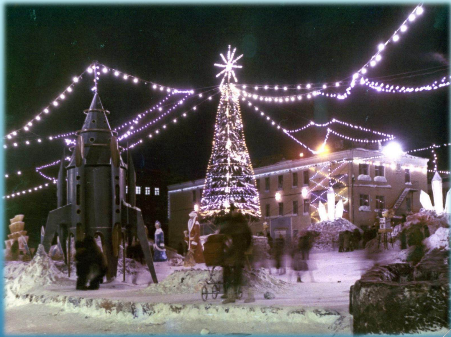
Новогодний городок на проспекте Ленина, между домов 19 и 25 г. Норильск, 1988 г.