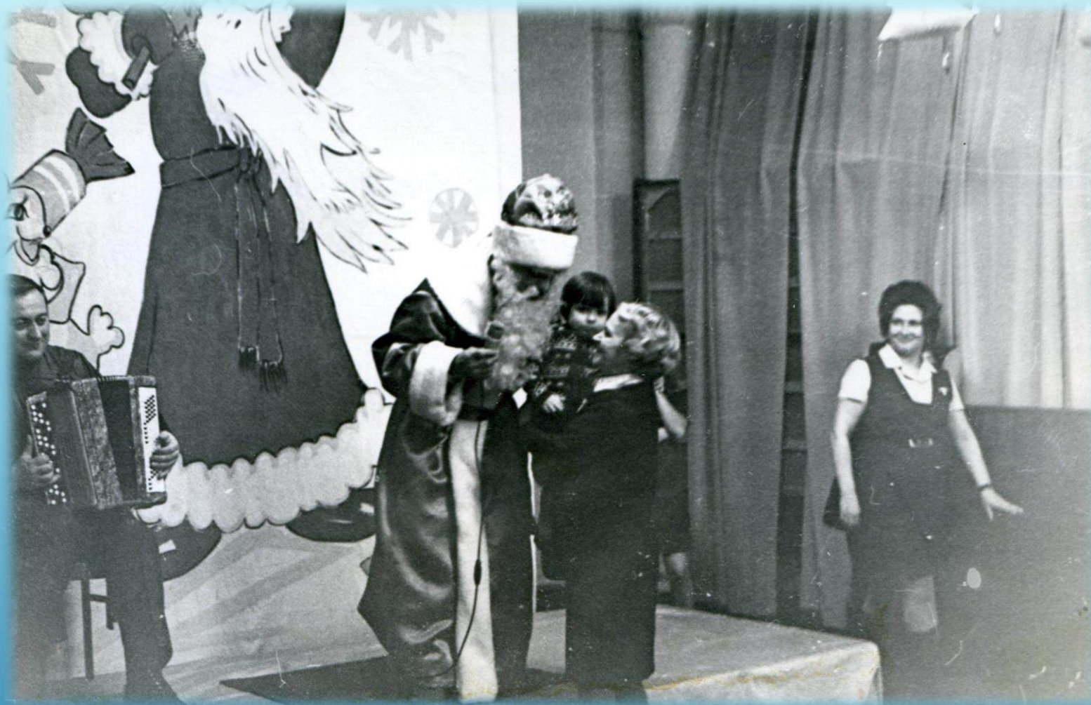
Новогодний утренник в Драматическом театре на ул. Севастопольской г. Норильск, 1970 г.