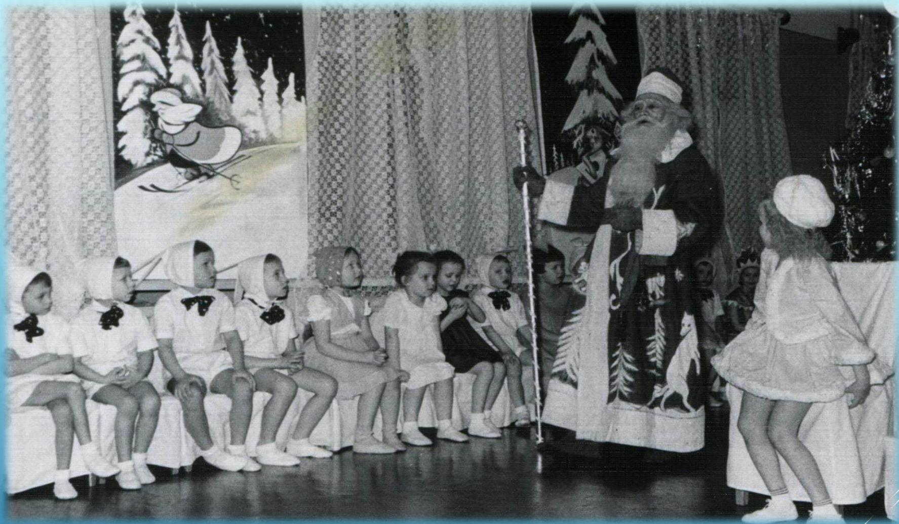
Дед Мороз на новогоднем утреннике в детском саду № 8 г. Норильск, 1960 г.