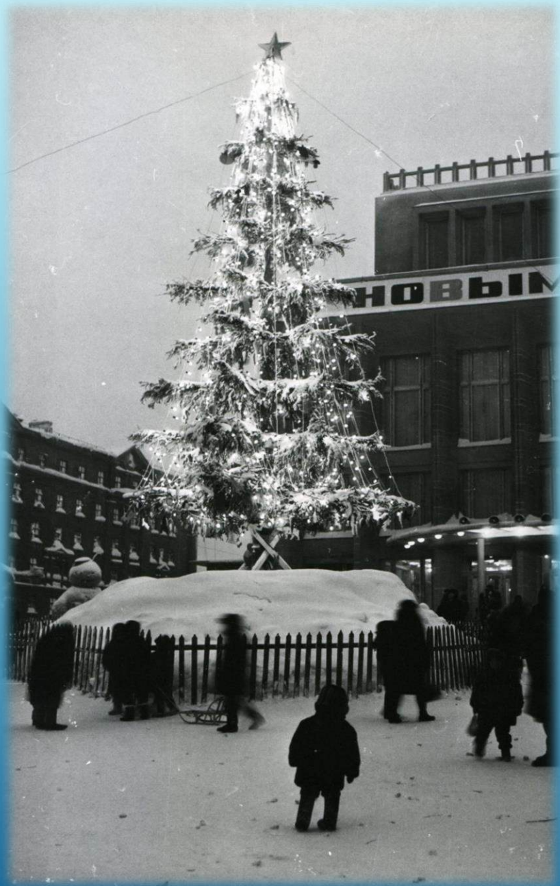
Новогодняя ёлка у Дворца культуры комбината г. Норильск, 1969