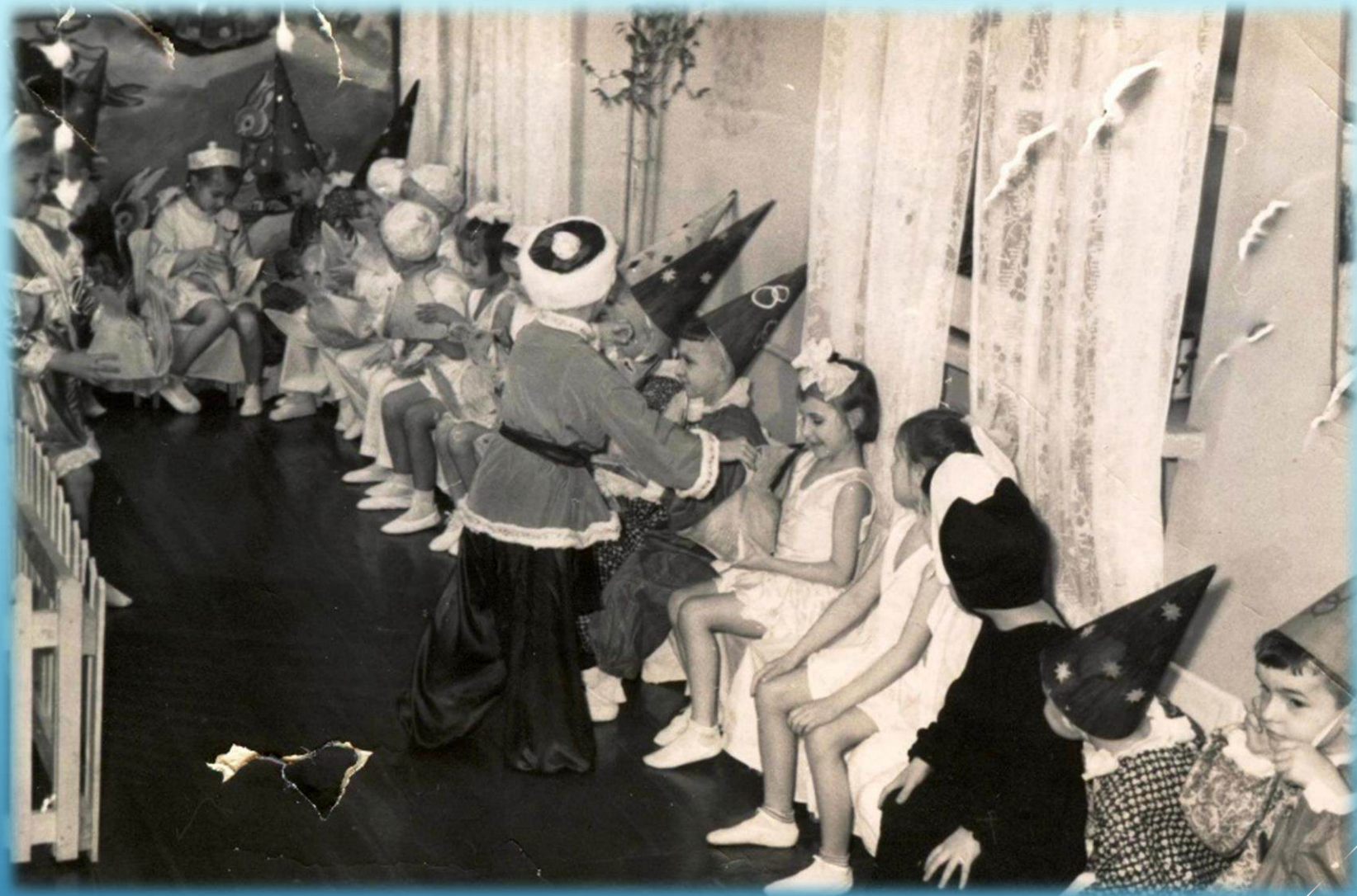
Новогодний утренник в детском саду на проспекте Сталина г. Норильск, 1960 г.