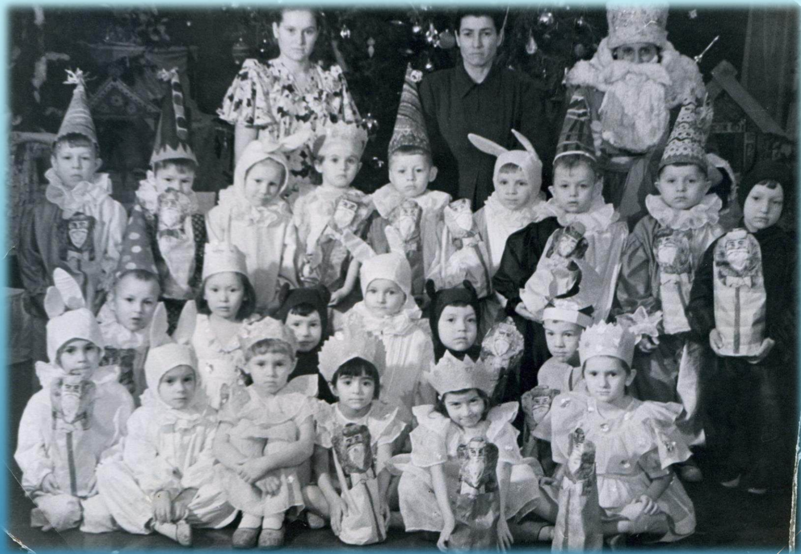
Новогодний утренник в детском саду «Горстроя» г. Норильск, 1954 г.