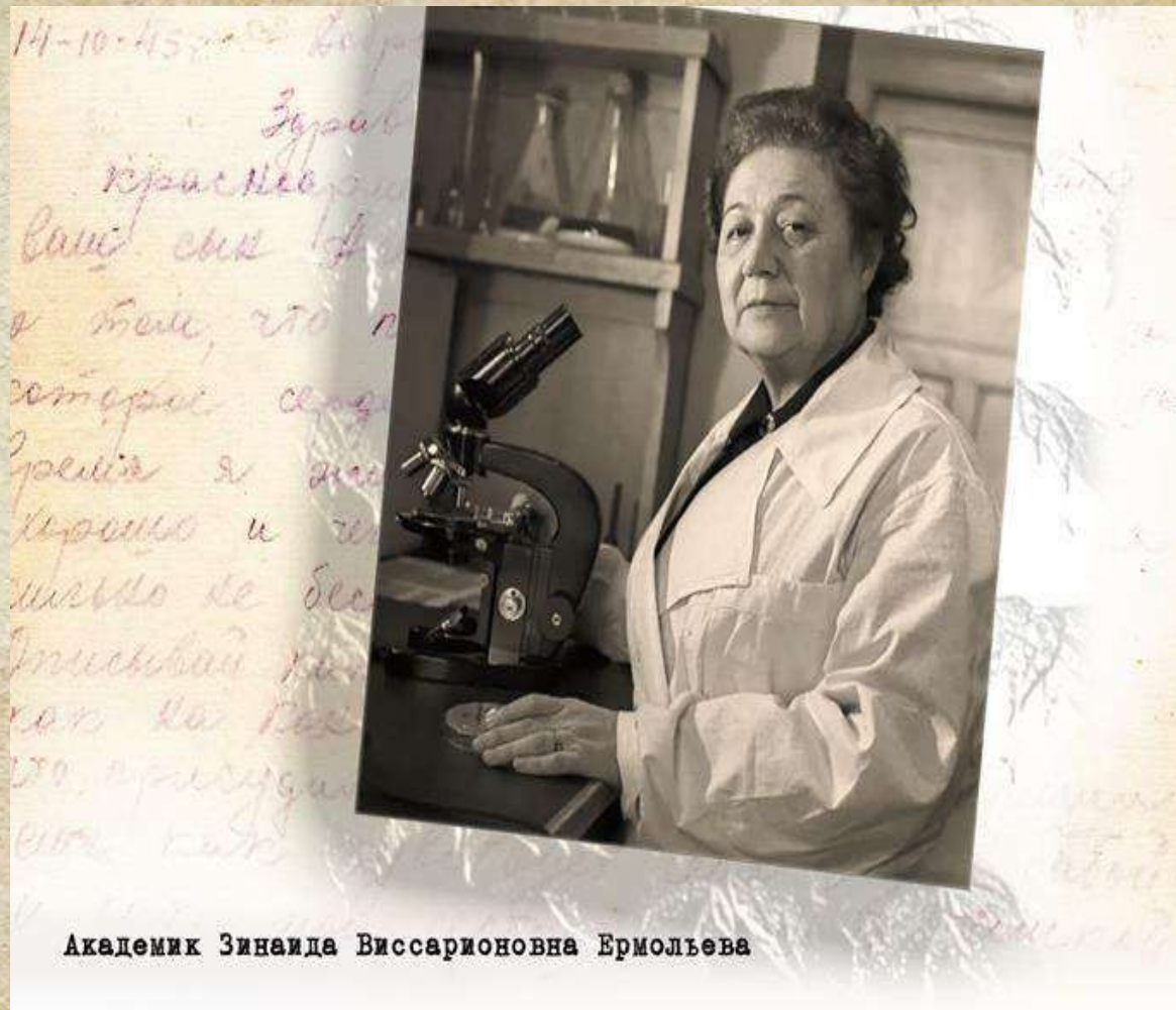
Академик Зинаида Виссарионовна Ермольева

Остановить вспышку удалось только за счет поголовного фагирования противохолерным бактериофагом практически всех военнослужащих в городе. Зинаида Виссарионовна за организацию этой героической работы была награждена орденом Ленина.