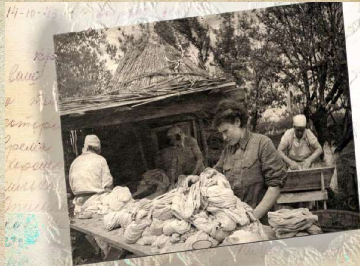
Прачечно-дезинфекционный отряд в действии

К 1944 году использование этих препаратов прекратилось. Им на смену пришёл революционный по тем временам ДДТ (в народе – «пыль»). В пропитанном им обмундировании паразиты вообще не приживались. О том, насколько серьезна опасность, которую этот препарат представляет для организма человека, учёные узнали лишь спустя 30 лет после войны и запретили его использование.