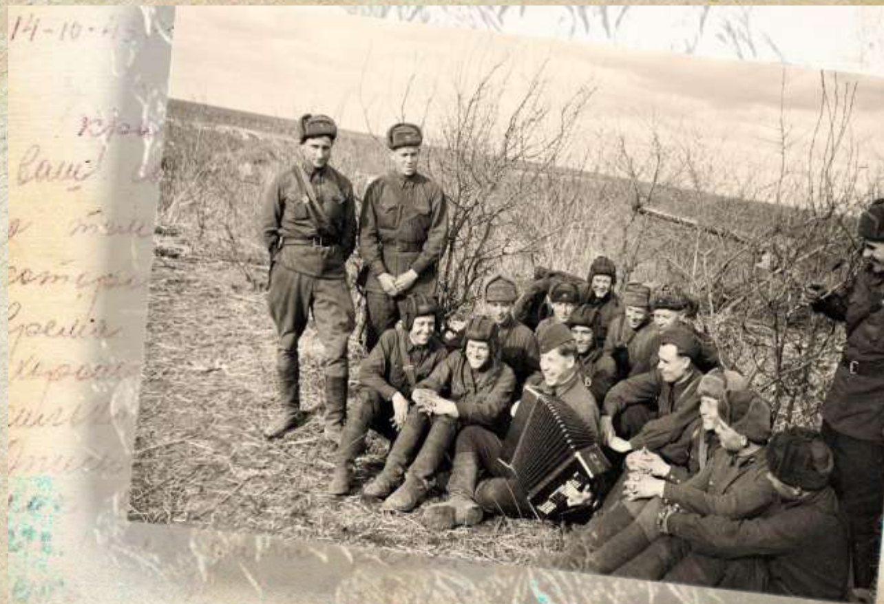
Бойцы во время короткой передышки

Но боевая работа для санитарно-эпидемиологической службы Красной Армии не закончилась в мае 1945 года – еще в течение пяти лет специалистам службы пришлось предотвращать последствия войны. К примеру, случаи малярии, бруцеллеза и сыпного тифа удалось ликвидировать только к 60-м годам.