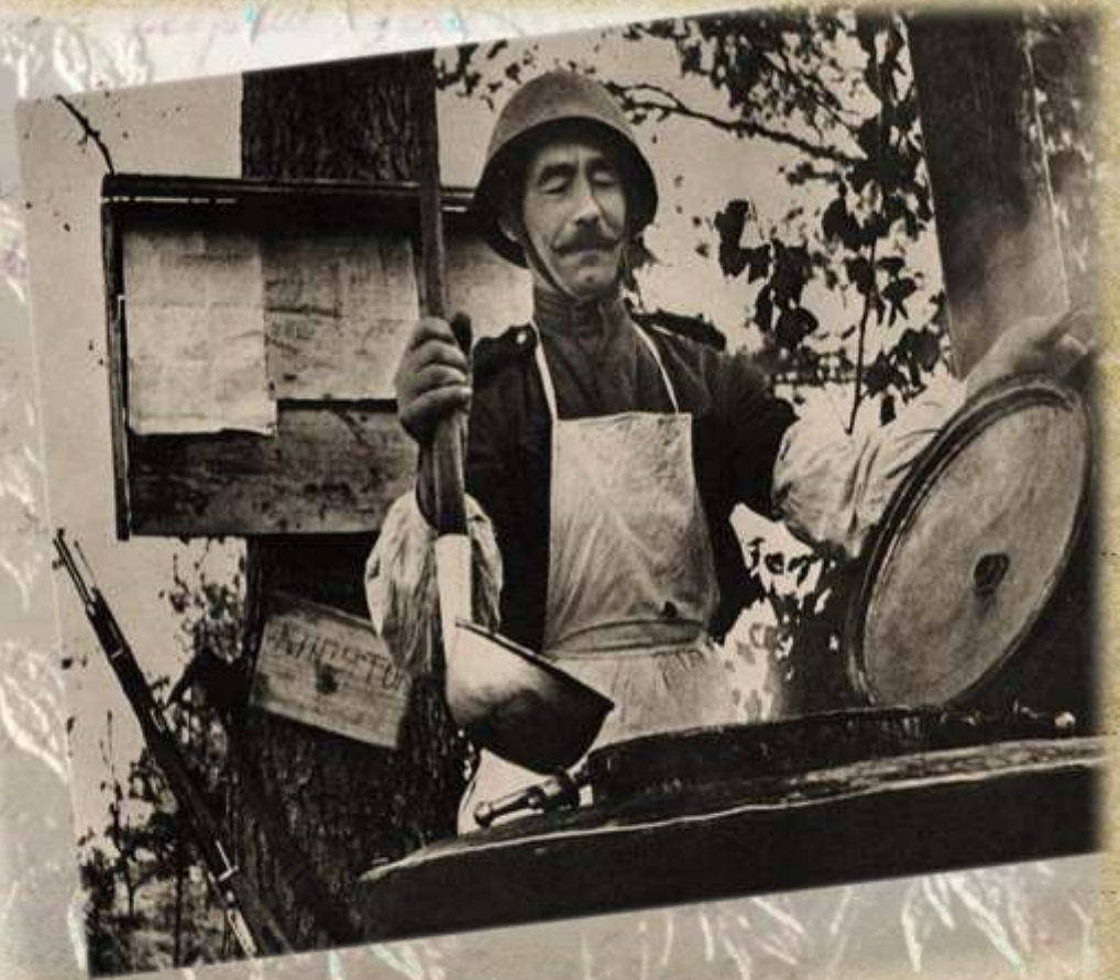
Советский солдат - повар полевой кухни. "Обед готов!"

Важным элементом санитарного надзора за питанием был ежедневный контроль не только за качеством питания, но и за состоянием транспорта, хранением и транспортировкой продуктов, размещением полевых кухонь, очисткой территорий и удалением пищевых отходов.